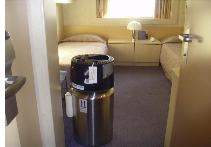
Arch Bronconeumol. 2012;48:55-60